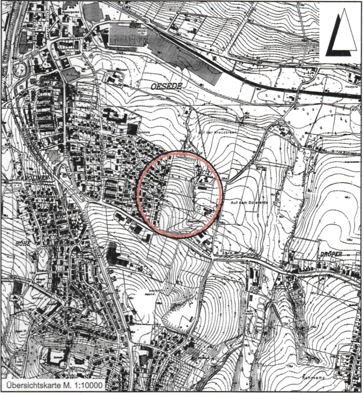
Übersichtskarte M. 1:10000