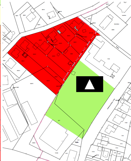
Anpassung im Wege der Berichtigung