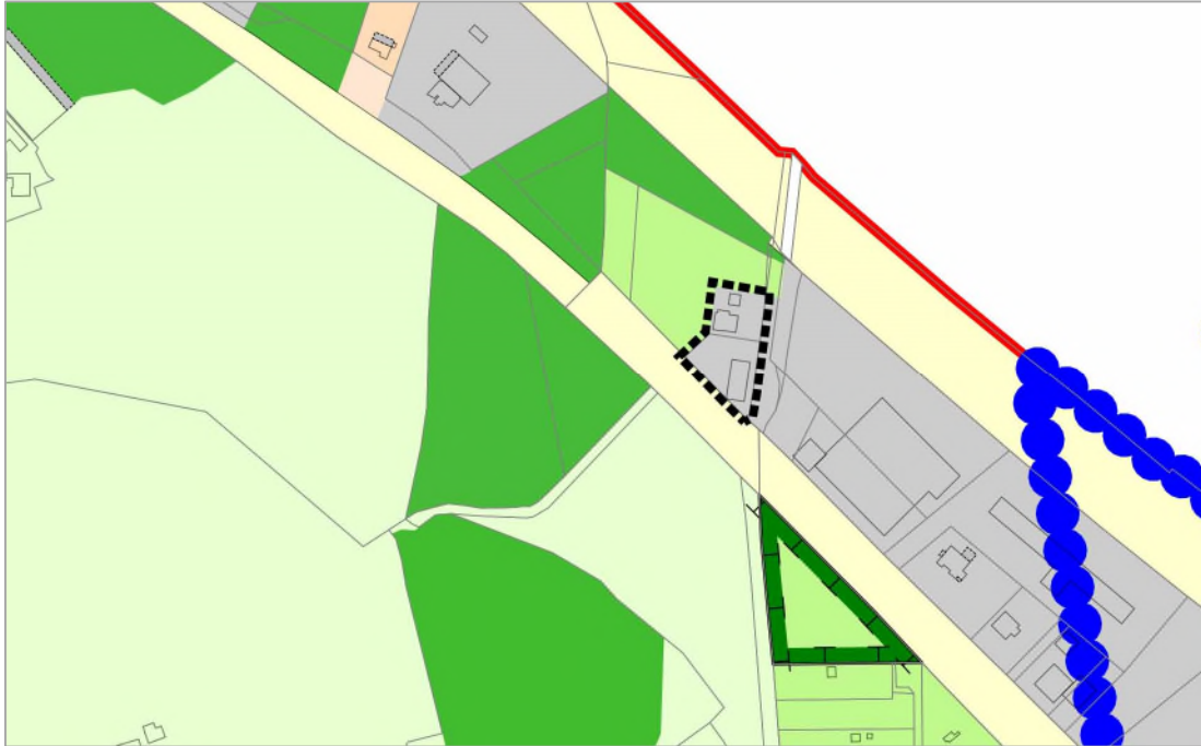
Ausschnitt aus dem wirksamen Flächennutzungsplan (Geltungsbereich der Anpassung)

Im wirksamen Flächennutzungsplan der Stadt Georgsmarienhütte ist das o.g. Plangebiet als „Gewerbliche Baufläche“ dargestellt. Gemäß § 13a Abs. 2 Nr. 2 BauGB wird deshalb im Zuge der Berichtigung für den Bereich (sh. Geltungsbereich der Anpassung) die Darstellung „Gemischte Baufläche“ angepasst.