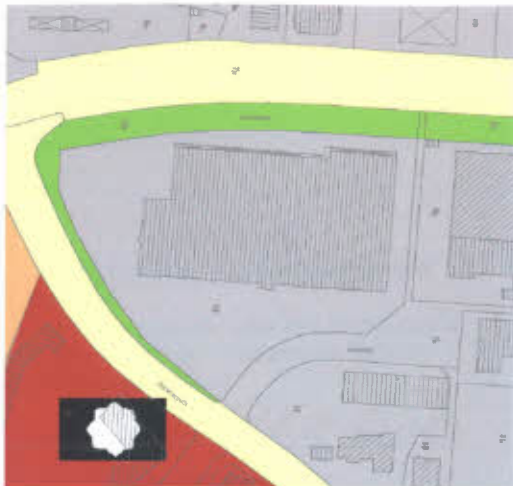
Ausschnitt aus dem wirksamen Flächennutzungsplan

Im wirksamen Flächennutzungsplan der Stadt Georgsmarienhütte ist das Plangebiet als Gewerbegebiet dargestellt. Gemäß § 13a Abs. 2 Nr. 2 BauGB wird deshalb im Zuge der Berichtigung eine Sonderbaufläche großflächiger Einzelhandel eingetragen.