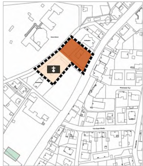
Anpassung im Wege der Berichtigung (Geltungsbereich der Anpassung)