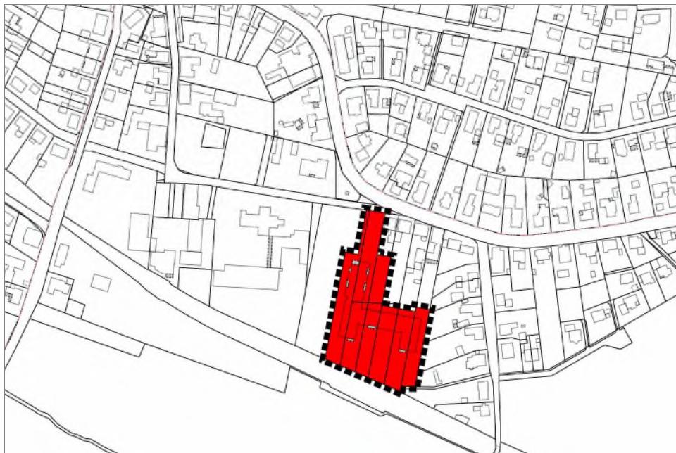
Anpassung im Wege der Berichtigung (Geltungsbereich der Anpassung)